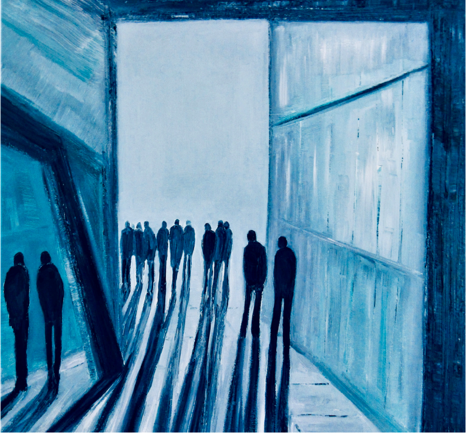
Jo Holdsworth, Into the Light, 2020